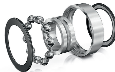
FAG Rillenkugellager FD mit Edelstahlkomponenten