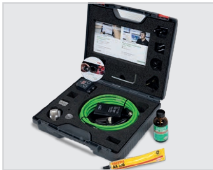
FAG SmartCheck Service-Kit