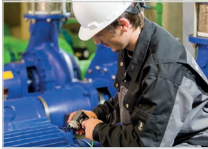
Einsatz des Messsystems an z.B. Motor, Pumpe, Lüfter