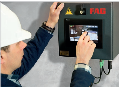
Anzeige im Touch-Panel