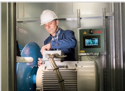
Online-Überwachung von Motor und Lüfter